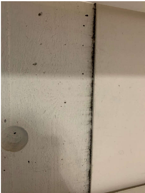
Loftun úr þakrými sem kemur niður í bókaeymslu á 2. hæð.