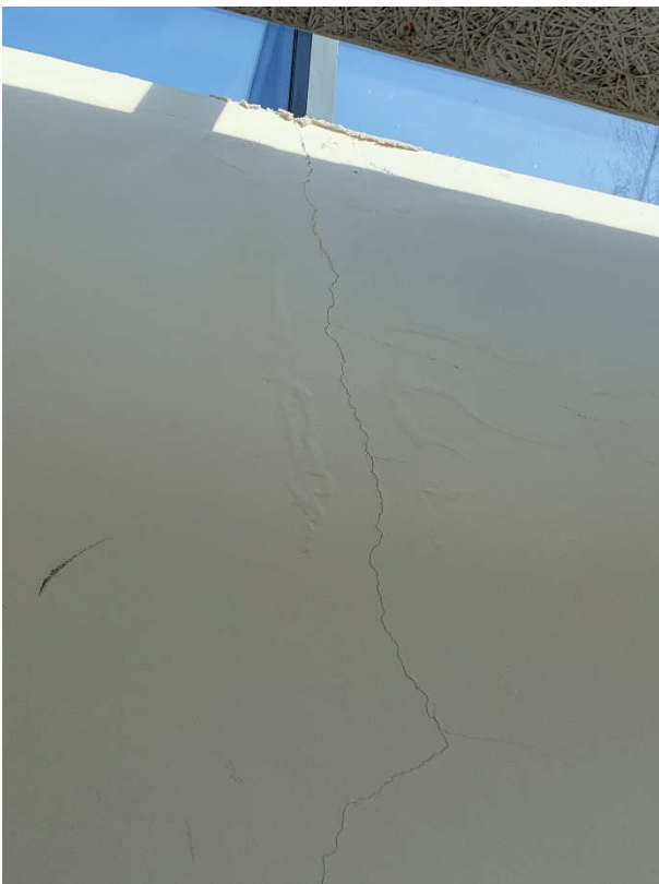
Merki um leka frá þakglugga í anddyri.