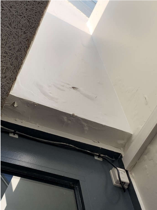
Leki frá þakglugga.