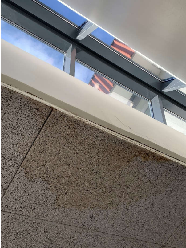
Gamall leki frá þakglugga við anddyri.